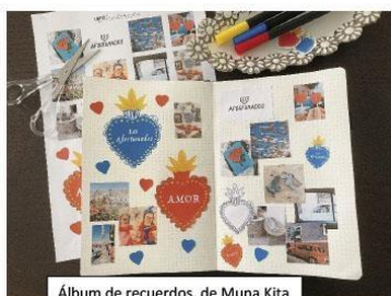
Álbum de recuerdos, de Muna Kita

En la 11ª Muestra Fotográfica de la revista, Muna Kita participó con una colección de fotos y recuerdos de México. Muna pensó que “sería una pena dejar que las fotos que había reunido durmieran en los discos duros”. ¿Nos acompañas a ver sus recuerdos? Encuentras el texto en la Muestra fotográfica de este número.